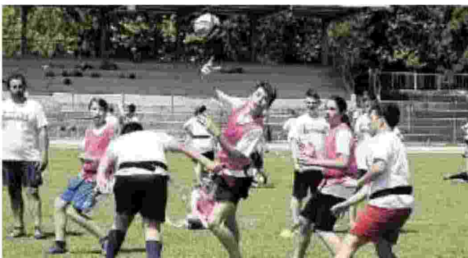
STADIO Momenti e alcuni dei giovani protagonisti della giornata che ha animato il Battaglini fino alla finali serali del Seven