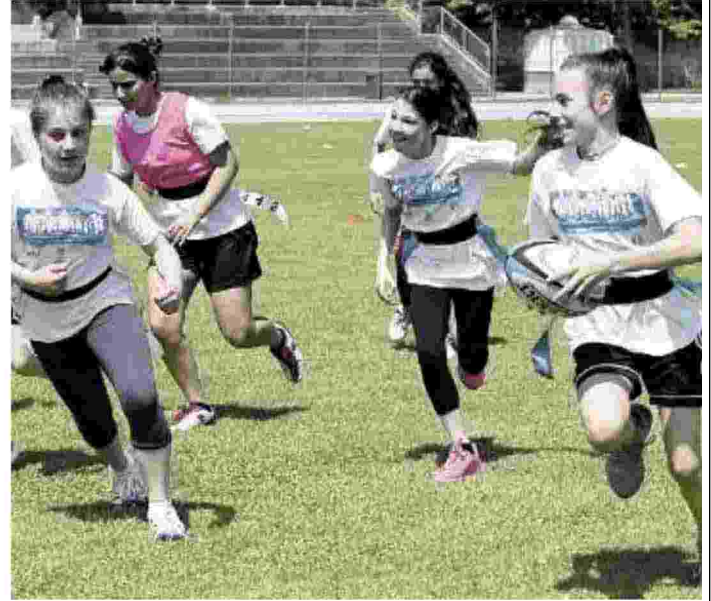
DIVERTIRSI INSIEME Alcuni degli appassionati accorsi al tentativo di record mondiale di mischia e a fianco una delle partite tra ragazzi che hanno segnato la giornata