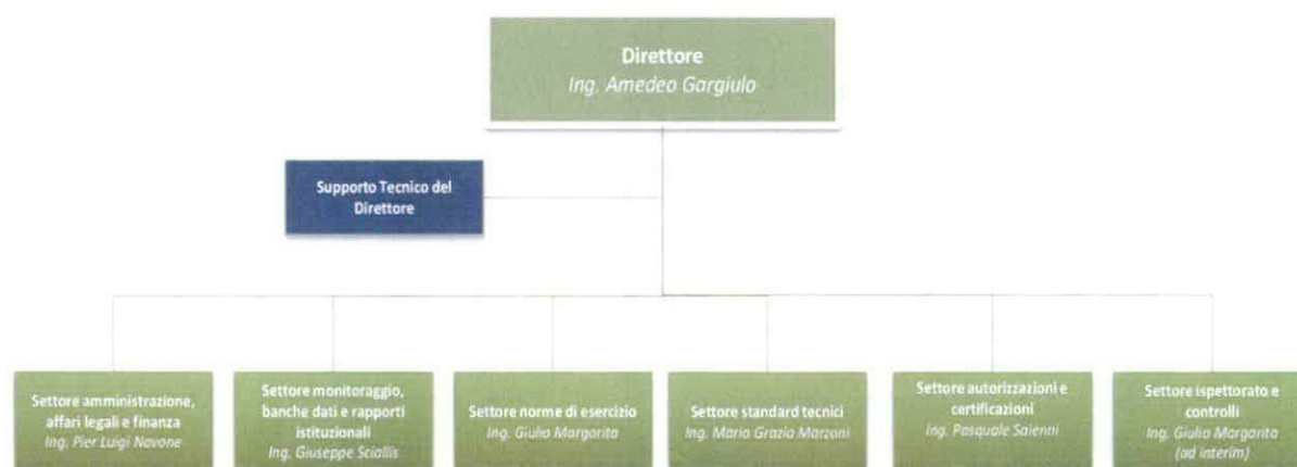
Figura 1: Organigramma dell'Agenzia Nazionale per la Sicurezza delle Ferrovie

L'Agenzia presenta un unico Centro di Responsabilità Amministrativa ed è organizzata in 6 Settori differenti per area di intervento. Nell'ambito di ciascun Settore sono istituiti gli Uffici, attualmente declinati come rappresentato nella tabella sottostante.