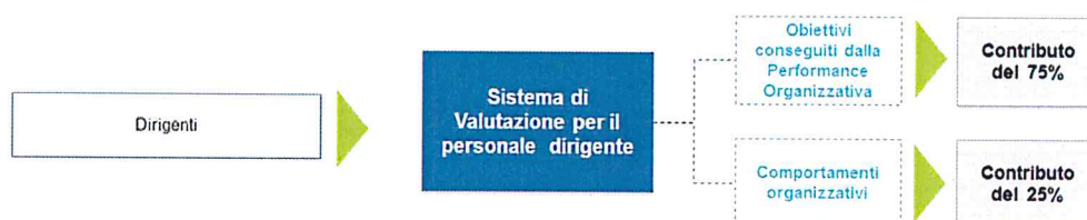
Figura 7: Performance individuale del personale dirigente