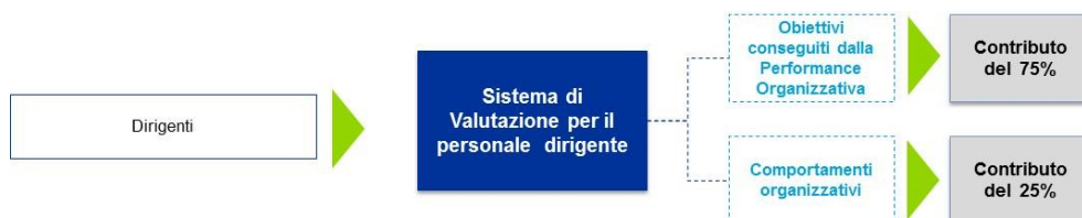
Figura 7: Performance individuale del personale dirigente