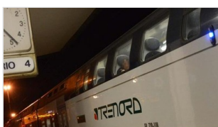
Mercoledì 07 ottobre 2015 «Freccia Bianca», ma Bergamo? «Siamo scavalcati