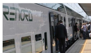
Martedì 06 ottobre 2015 Treni, 5 milioni di persone a Expo La biglietteria di Treviglio